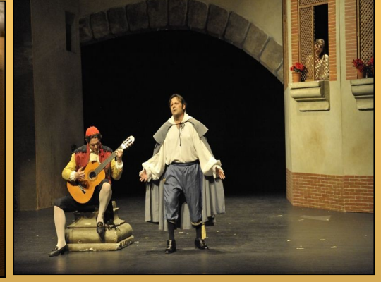
"El barber de Sevilla" en el Teatro Auditorio de Guadaira (Sevilla)