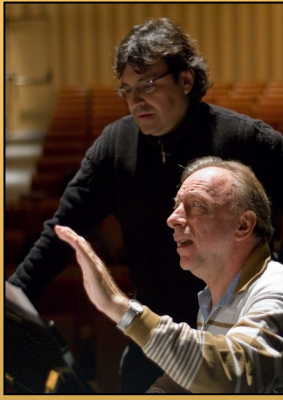
Con el Maestro Dante Mazzola